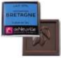
Chocolat au lait 37% à la fleur de sel