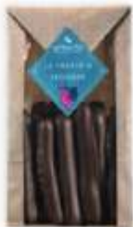
30. Sachet orangettes (130g)