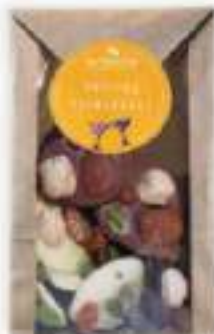
34. Sachet minis mendiants (110g)