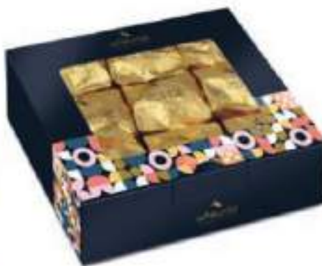
15. Coffret 9 marrons glacés entiers de Naples (165g)

Elles sont truffées de bons ingrédients pur beurre de cacao et chocolat 58% pour une texture tendre et fondante.