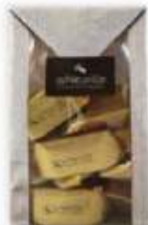
35. Sachet Gianduja (150g)