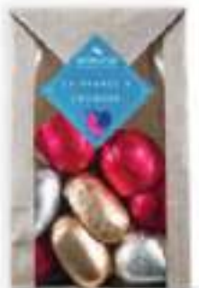
33. Sachet liqueurs (150g)