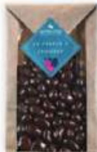
32. Sachet raisins au Sauternes (160g)