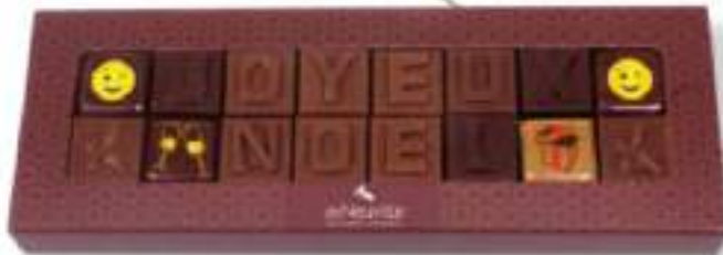
9. Message «Joyeux Noël» (80g)