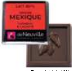
Chocolat lait 40% au goût crémeux et cacaoté