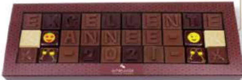
11. Message «Excellente année 2021» (150g)