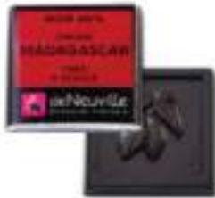
Chocolat noir 66% au goût frais et acidulé