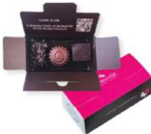
40. Lot de 10 minis ballotins (30g x10)