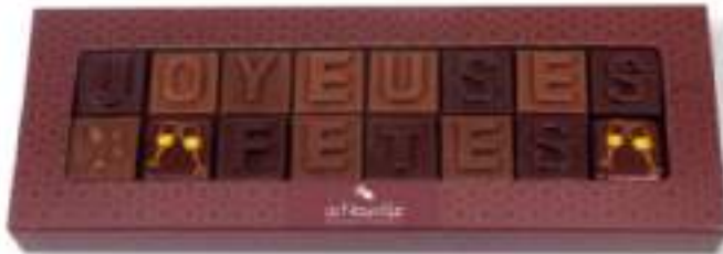
10. Message «Joyeuses fêtes» (80g)