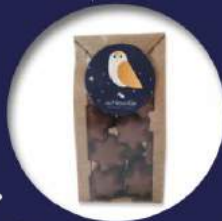
19. Sachet assorti de 16 guimauves enrobées de chocolat lait et noir (135g)