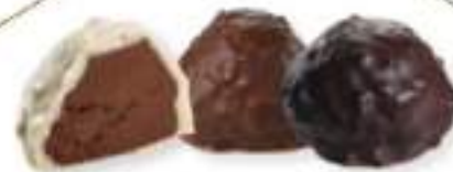
36. Rocher blanc (40g)