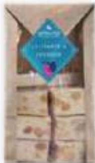
31. Sachet nougats (150g)