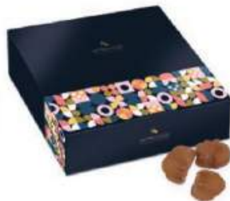
16. Coffret marrons en morceaux (250g)

Un goût franc et intense de châtaigne grillée.