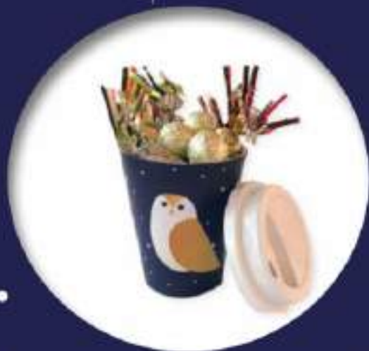
17. Petit mug chocolat (135g) Mug 100% naturel en bambou garni de boules en chocolat et de papillotes en chocolat