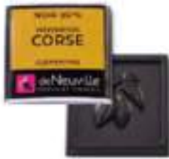
Chocolat noir 60% à la clémentine