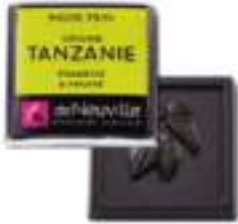
Chocolat noir 75% au goût torréfié et fruité