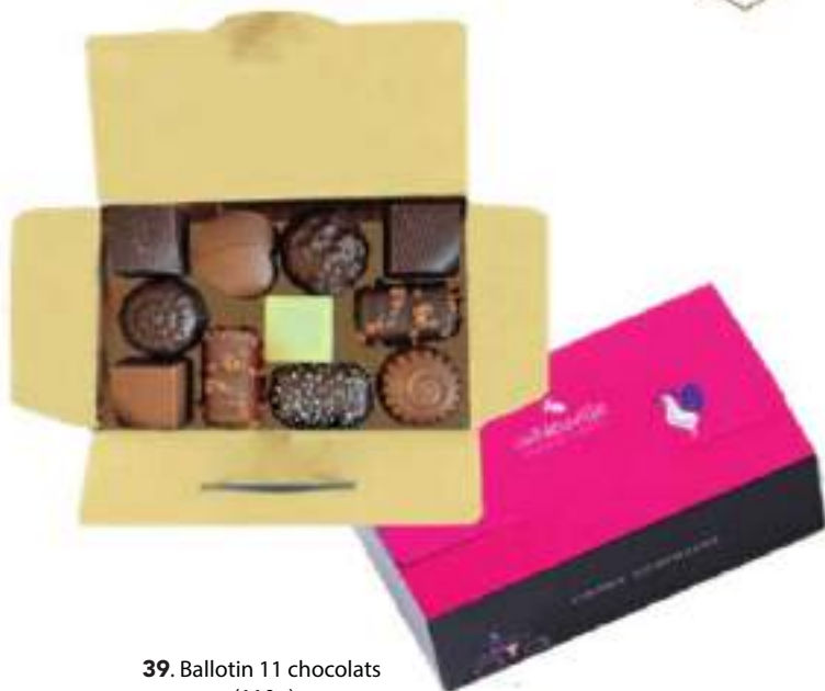
39. Ballotin 11 chocolats (110g)