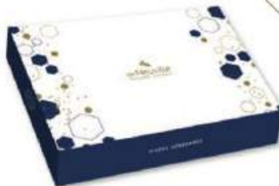
13. Grand coffret de Noël garni de fins chocolats et de mendiants au chocolat noir, lait ou blanc (495g)