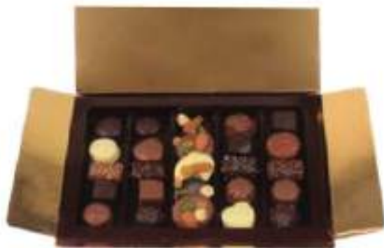
12. Coffret de Noël garni de fins chocolats et de mendiants au chocolat noir, lait ou blanc (245g)