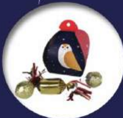
18. Boîte berlingot (60g) Garnie de boules en chocolat et de papillotes en chocolat