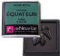
Chocolat noir 85% au goût amer et boisé

Goûtez aux origines du chocolat. Acidulé de Madagascar, fruité de Tanzanie, lacté du Mexique, découvrez les goûts de nos napolitains.