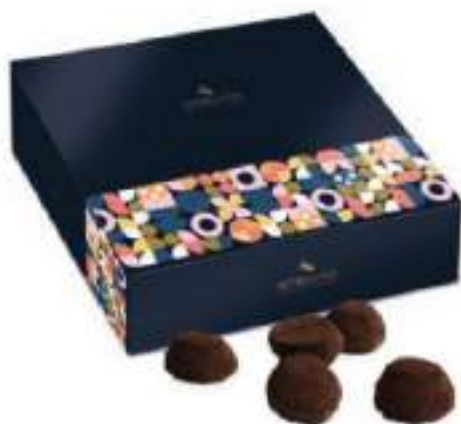
14. Coffret truffes véritables (250g)

Elles sont truffées de bons ingrédients pur beurre de cacao et chocolat 58% pour une texture tendre et fondante.