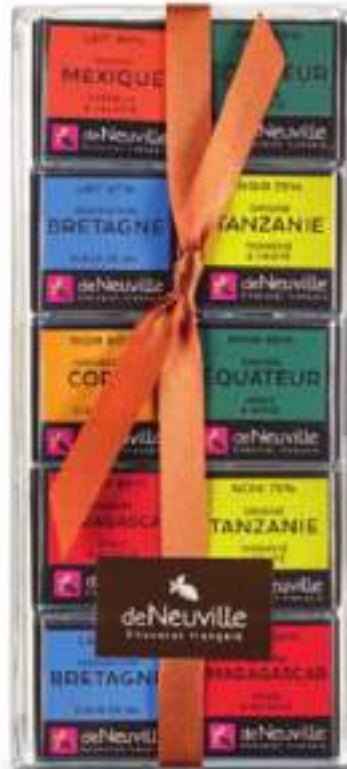
29. Réglette 40 Napolitains (200g)

Goûtez aux origines du chocolat. Acidulé de Madagascar, fruité de Tanzanie, lacté du Mexique, découvrez les goûts de nos napolitains.